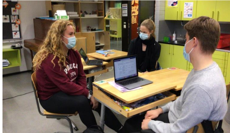
Учитель - супервізор - два студенти- практиканти, пара