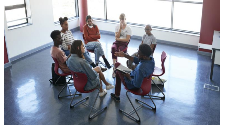
Учитель-супервізор- група студентів- практикантів