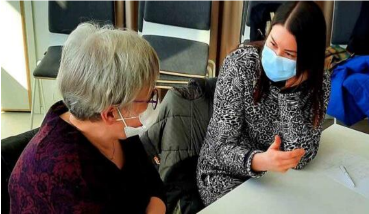
Учитель-супервізор - студент-практикант